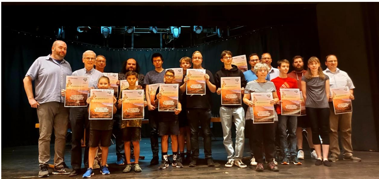
(Die Preisträger A- und B-Turnier)

Seitens der Spieler kam viel Lob für die tolle Ausrichtung und die sehr guten und großzügigen Spielbedingungen. Am Ende der Siegerehrung verkündete Bernd Kühn, dass die 2. Schachtage Naturerlebnis Pfälzerwald vom 30.08 bis 03.09.2023 im Congress Center Ramstein stattfinden werden.