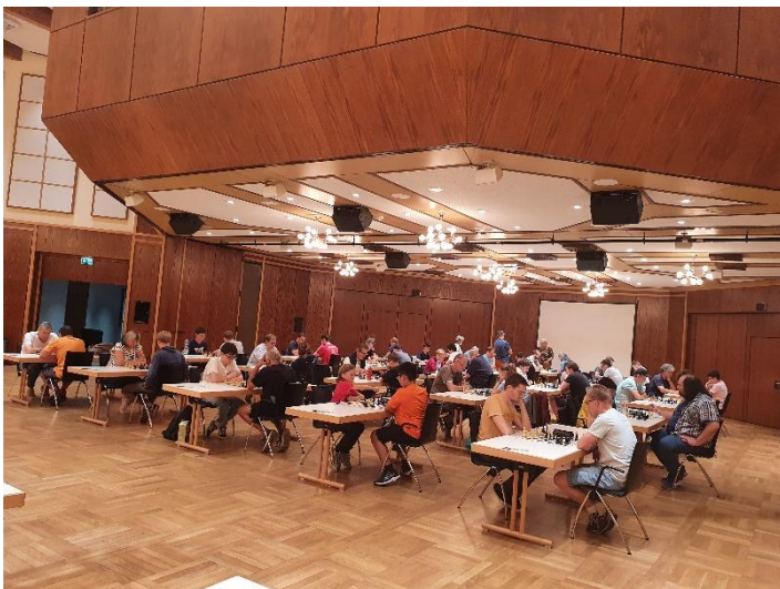
Blick in den Turniersaal beim Blitzturnier