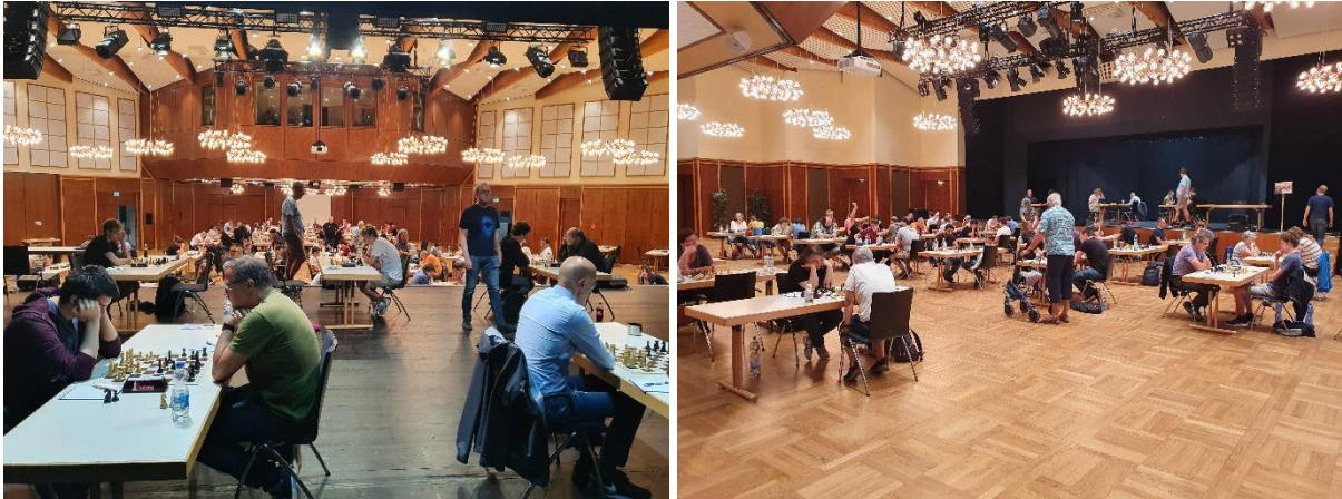
Blick in den Turniersaal